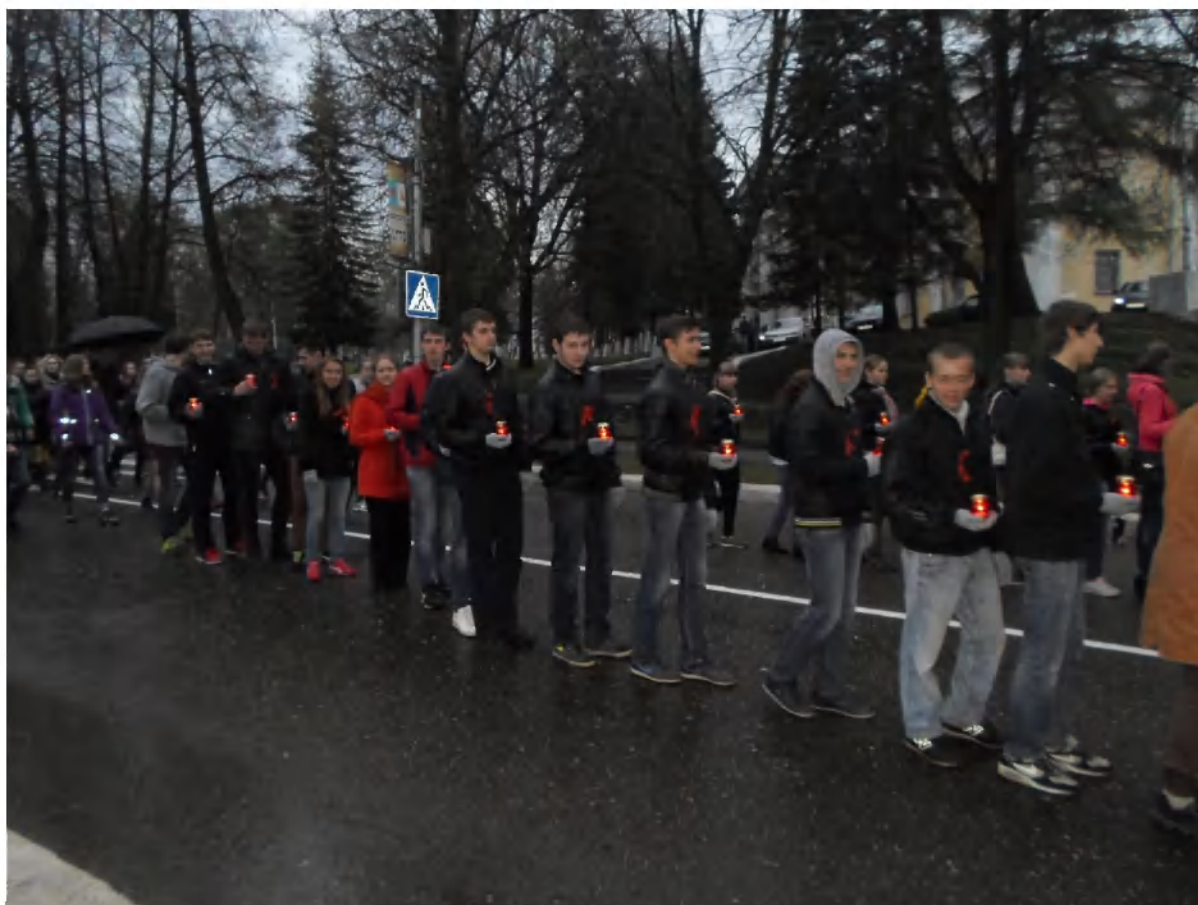
Участники игры «Школа безопасности. Зарница-2014» 9 мая 2014 года возложили цветы на «Аллее Героев».